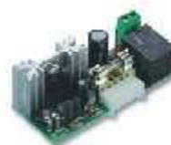
CARICA karta ładowania akumulatorów do siłownika RO1124