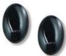
BF fotokomórki (para), zasięg 15 - 30 m