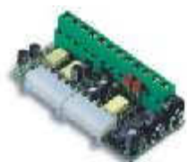
PIU karta rozszerzająca funkcje central (funkcje strona 48/49)