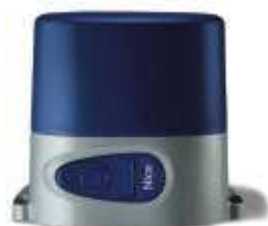
RO300 siłownik 230V z wbudowaną centralą sterującą