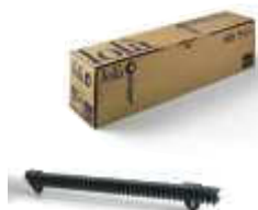
LOLA listwa zębata nylonowa M4, w odcinkach po 0,5 metra, pakowana po 10 sztuk, cena za 5 mb