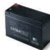
B12-B akumulator 12 V 6.0 Ah do siłowników 24V